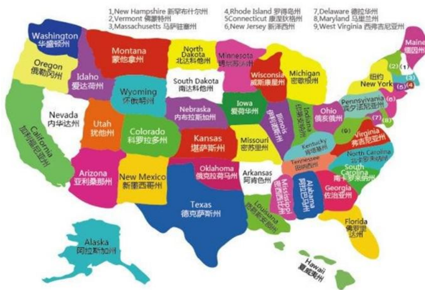
图 1 美国地理概貌

美国共分 50 个州和 1 个特区（哥伦比亚特区，首都华盛顿所在地），5 个自治领地。五个自治领地里，联邦领地包括波多黎各和北马里亚纳；海外领地包括关岛、美属萨摩亚、美属维尔京群岛等。